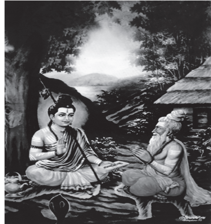
ശ്രീ ജഗദ്ഗുരു ഭരണുകാല്യാചാര്യരും അഗസ്ത്യമഹർഷിയും