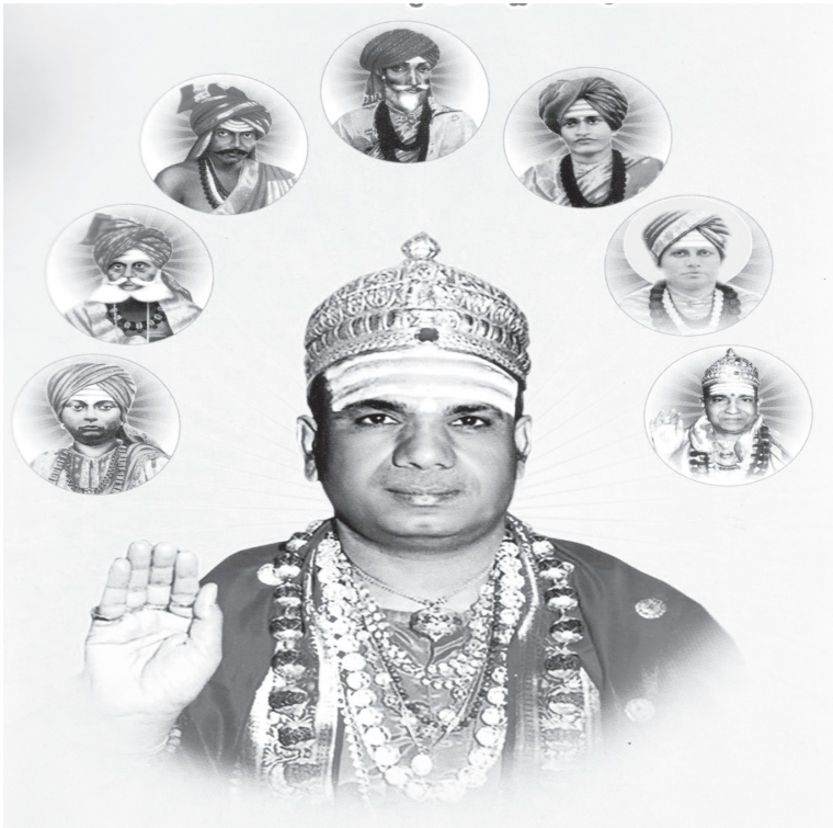
ശ്രീമദ് കാശി വിശ്വാരാധ്യ അനാനസിംഹാസനാധിപര ശ്രീ 1008 ജഗദ്ഗുരു ഡോ. ചന്ദ്രശേഖരശിവാചാര്യ മഹാസ്വാമിജിയും മുൻ മഠാധിപതികളും